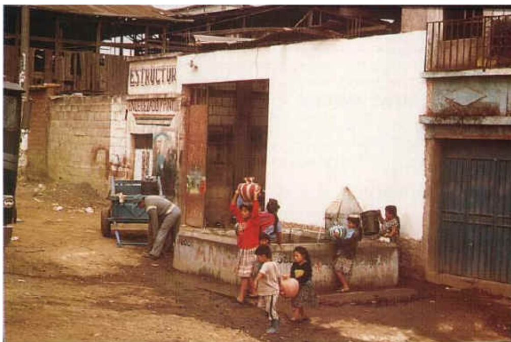
Donne e bambini aliti ricerca di acqua